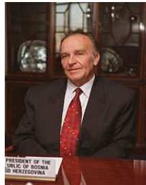
Alija Izetbegović Président de la Bosnie