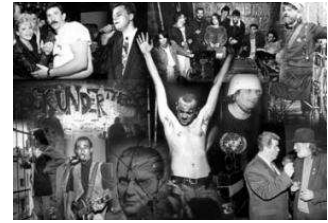
Vivre pour ne pas mourir