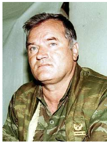
Ratko Mladić Chef de l'armée des bosno-serbes extrémistes