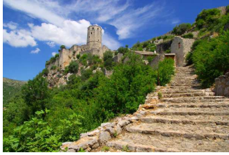
Les handicaps à surmonter