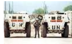
Casques bleus de l'ONU