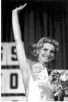
Election de Miss Sarajevo assiégée