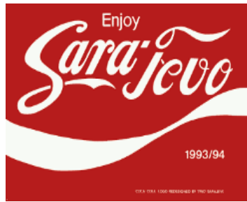
Publicité détournée de Coca Cola