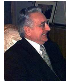
Franjo Tuđman Président de la Croatie