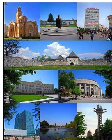
Banja Luka « capitale » de la République