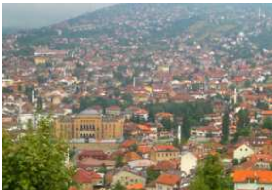
Sarajevo capitale de la Bosnie et de la Fédération