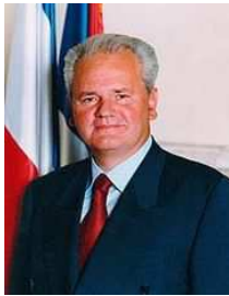
Slobodan Milošević Président de la Serbie

→ Quelques protagonistes de cette guerre