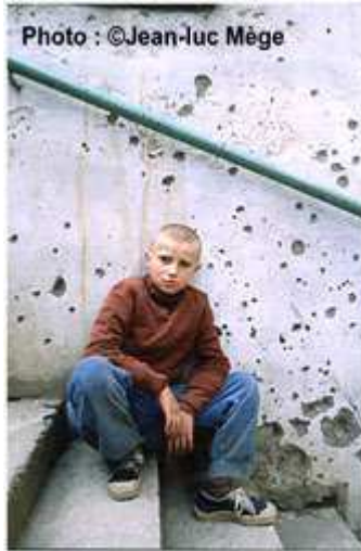
Orphelin des rues Sarajevo 1994