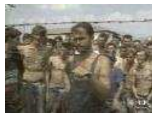
Camp de concentration d'Omarska