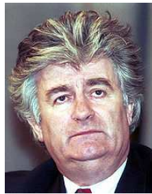
Radovan Karadžić Dirigeant politique des bosno-serbes extrémistes